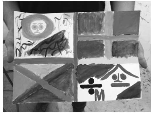
Abb. 2 Traurig sein

aus ihrer Heimat darstellt. Der Korb ist zum Einkaufen auf dem Markt. Das verstehen alle. Nach der Ausstellung und den Werkgesprächen entscheiden die Jugendlichen, was sie mitnehmen wollen, und was im Atelier bleibt.